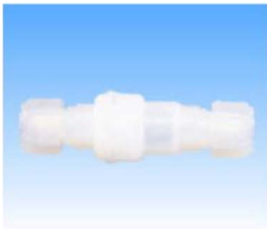
Check Valve Type:PGB

閥體由 PTFE 和 PFA 材質製成, 可使用於各種化學溶液。 小型設計, 重量輕, 性能高